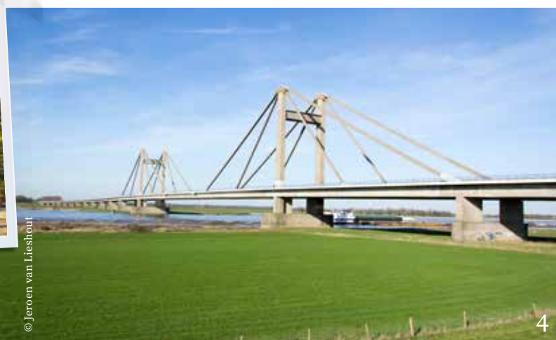
1 Moeke Mooren was ooit boerderij, café en veerhuis aan de Blauwe Sluis. 2 De Ronde Molen in Maasbommel doet tegenwoordig dienst als Bureau voor Toerisme. 3 Heerlijk struinen en inspiratie opdoen in de Tuinen van Appeltern. 4 De bijna anderhalve kilometer lange Prins Willem-Alexanderbrug houdt beide oevers van de Waal bij elkaar.

parkeermogelijkheid in de omgeving. Op weg naar KP 86 passeer je eerst een statige molen terwijl wat verder de majestueuze Prins Willem-Alexanderbrug de even majestueuze Waal overspant. Zwaar geladen vrachtschepen kruisen elkaar. In Echteld zie je in de verte kasteel Wijenburg, rechttegenover de kerk. Beide houden elkaar blijkbaar in de gaten. Het kasteel is een typische waterburcht en levert vanuit het bijbehorende park enkele mooie plaatjes op. De burcht zelf kan niet bezocht worden.